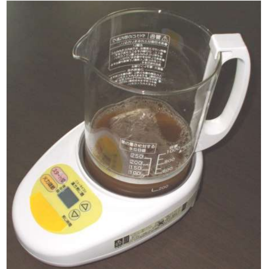
写真1 市販煎じ器 蓋を外して用いる

成分:グリチルリチン酸(g、甘草)、エフェドリン類(e、エフェドリン+プソイドエフェドリン、麻黄)、ペオニフロリン(p、芍薬)、k、いずれもHPLCにより定量した。