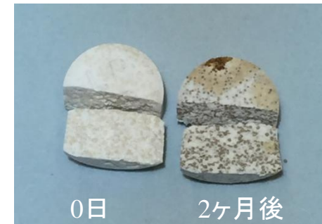
ランソプラゾールOD錠15mg「サワイ」