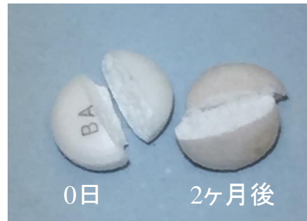
バイアスピリン錠100mg