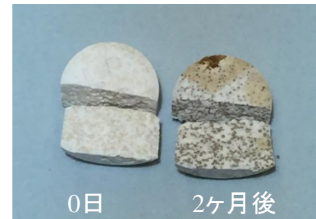
ランソプラゾールOD錠15mg 「サワイ」